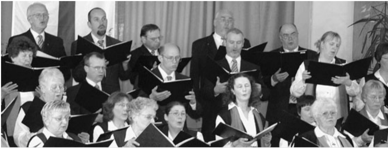
Sonntag-Kantate im Gemeindehaus Schwaneweide: Kirchenchor, Evangeliumschor und Orchester.