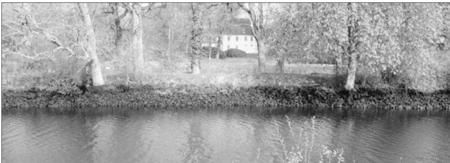
Frisches Frühlingsgrün an der Hamme: Paradeplatz für die Torfkahn-Armada